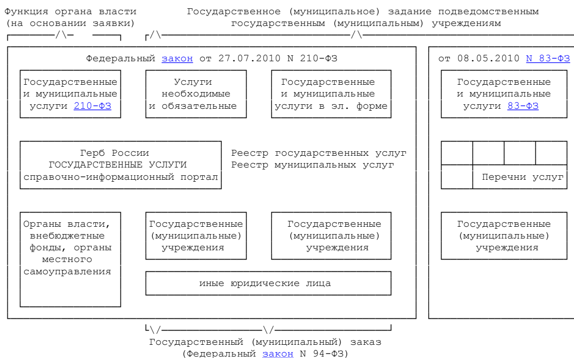
Рисунок 1. Государственные (муниципальные) услуги и их отличия в контексте Федерального закон от 27 июля 2010 г. N 210-ФЗ и Федерального закон от 8 мая 2010 г. N 83-ФЗ

Федеральный закон от 27 июля 2010 г. N 210-ФЗ регламентирует предоставление государственных (муниципальных) услуг органами власти в ходе реализации ими своих функций при осуществлении возложенных на них или переданных с другого уровня полномочий (например, выдача разрешения на строительство, предоставление выписки из реестра недвижимого имущества).